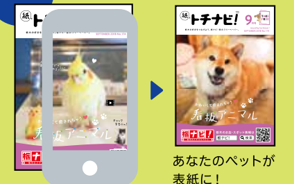
あなたのペットが表紙に! ※画像はイメージです。