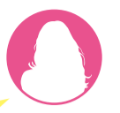
ニックネーム クロパン / 女性

日本最古の足利学校、国宝の鍔阿寺を着物に着替えて観光出来るよ。あしががフラワーパークも春の藤は見事です。冬はイルミネーションが素敵だよ。