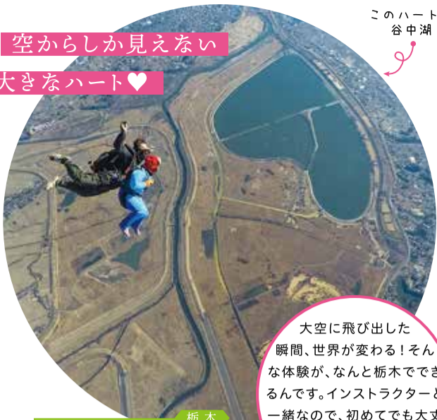
このハートが谷中湖