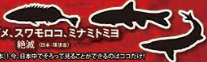
チョウザメ、スワモロコ、ミナミトミヨ

メコン川水系に生息し、成長 すると全長3m、体重300kg にもなる世界最大級のナマス!