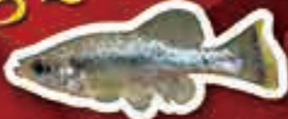
アメカスブレデンス