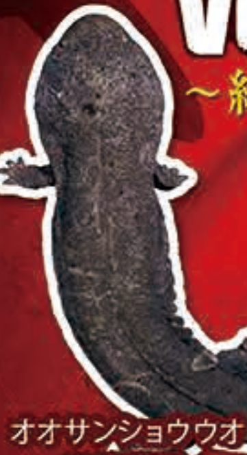
オオサンショウウオ