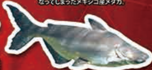
メコンオオナマス