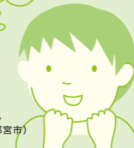
クマっちさん (男性/宇都宮市)