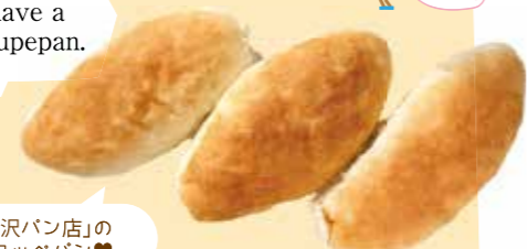
宇都宮「成沢パン店」のふかふかコッペパン♡