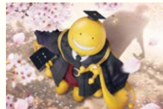
▲担任の殺せんせー