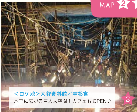
▲剣心が比古清十郎の下で修行するシーン